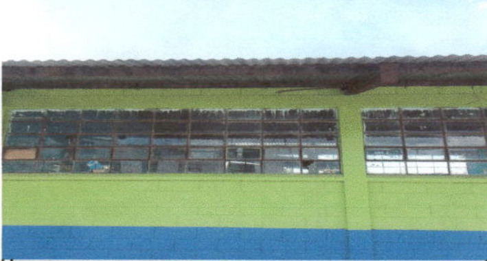
Foto1: Sustitución de ventanas de madera por metal más vidrio