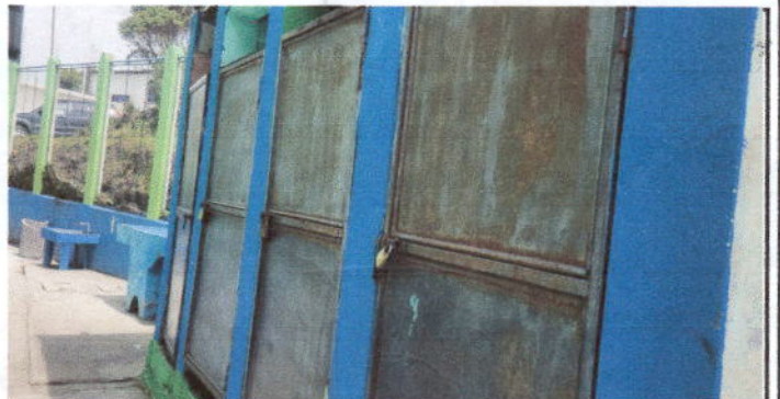
Foto 6: Mantenimiento a estructura ( lijado, aplicación de pintura

Observación: Si es necesario se pueden agregar hojas adicionales actualizando el número de hojas.