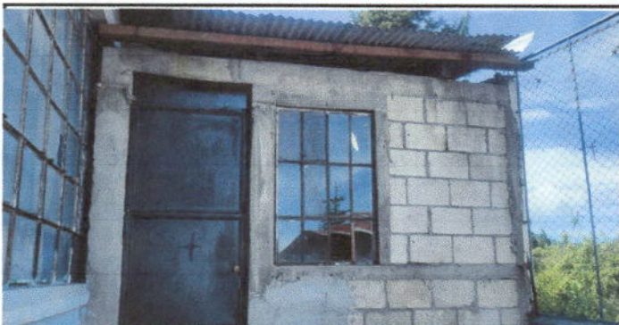
Foto 5: Sustitución de lámina por lámina troquelada aluzinc calibre 26